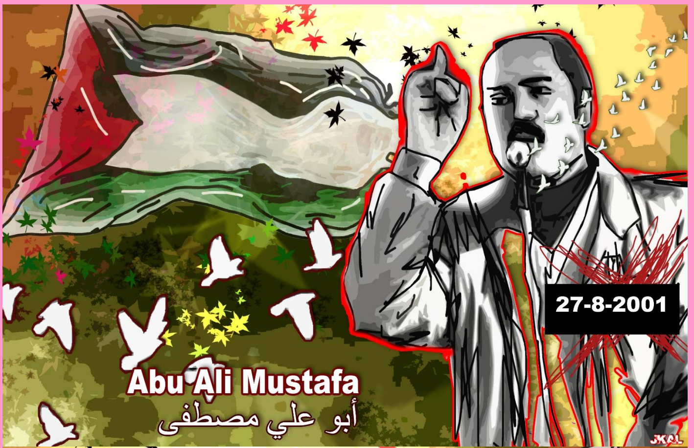
Abu Ali Mustafa أبو علي مصطفى